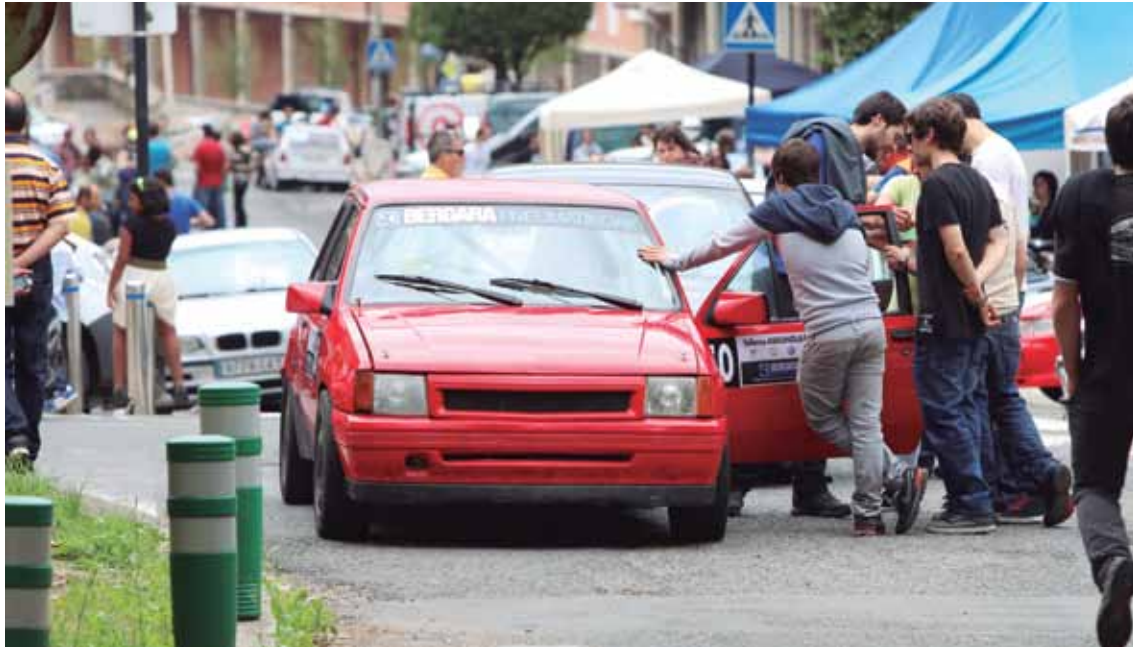
Autoak, Boluan, igoerara gerturatzeko prest.