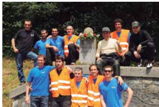
Gorla Racingeko kideak Ayrton Sennaren oroigarrian.