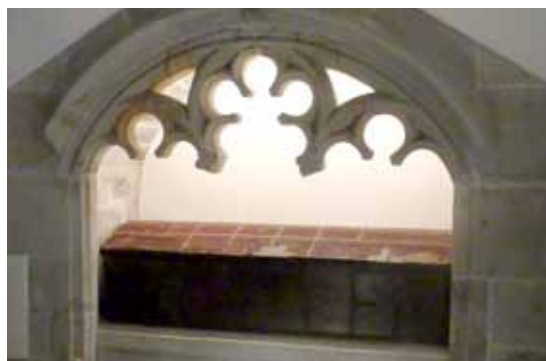
Amandre Santa Ines-en gorpuaren hilkutxa parrokiaren.